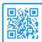
Zorg vanuit de Wlz (website CAK)