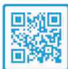
Folder Ontevreden of klachten?