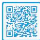
Brochure Hulpmiddelen Wlz